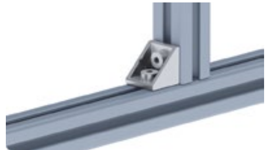
Aluwinkel 20 Alu Connection Angle 20